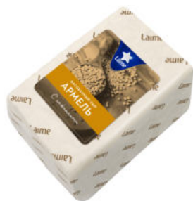
Сыр LaiMe Армель 50%

Сыр LaiMe Армель с пажитником – полутвердый сыр с плотной однородной сырной массой. Вкус нежный, пряный, с легкой ореховой нотой. Семя пажитника славится укрепляющими свойствами и помогает выводит шлаки.