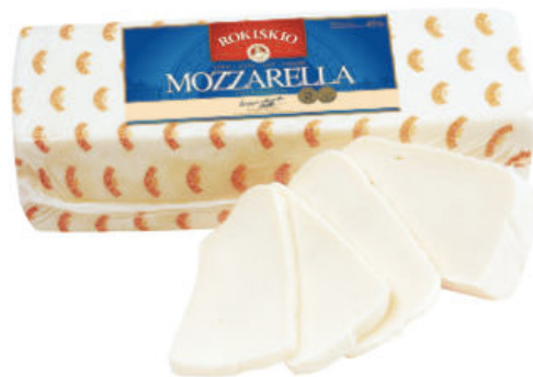
Сыр Моцарелла Рокишкио 45%

Сыр Моцарелла Рокишкио – молодой сыр, приготовленный по итальянскому рецепту. Подходит для приготовления пиццы, салатов, горячих бутербродов. Хорошо плавится и режется.