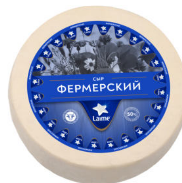
Сыр LaiMe Фермерский 50%

Сыр LaiMe Фермерский – полутвердый сыр с ажурным рисунком, натуральным сливочным вкусом. Прекрасно режется и трется. Отличный вариант для питательных завтраков с цельнозерновым хлебом и творогом.