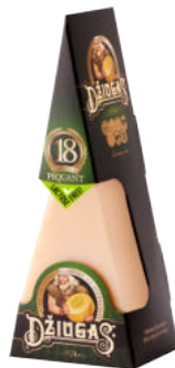
Сыр Пармезан Джюгас 18 месяцев треугольник 40%

Сыр Пармезан Джюгас сроком созревания 18 месяцев – сыр отличается пикантным вкусом, желтым цветом, в нем заметны белые кристаллы кальция. Порезанный тонкой стружкой сыр не только улучшит вкус, но и украсит супы и салаты. Сочетается с сухофруктами и хлебными палочками.