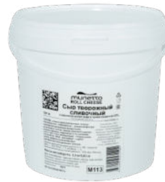
Сыр Roll Cheese творожный сливочный Милетто 62%

упаковка 3,3 кг / 1 шт упаковка 10 кг / 1 шт