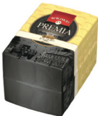
Сыр Премия Рокишкио 45%

Сыр Премия Рокишкио – полутвердый сыр, с мягким нежным вкусом, пряным ароматом, питательный. Сыр прекрасно подойдет как для нарезки, так и для добавления в запеканки, бутерброды, соусы.