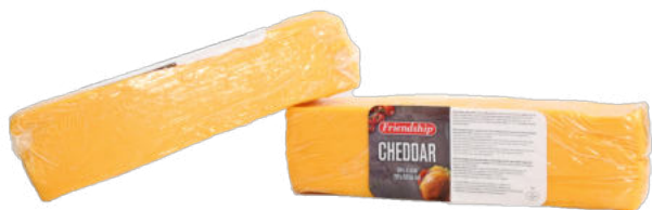
Сыр Чеддер Friendship

Сыр Чеддер Friendship – твердый сыр, произведенный по традиционному английскому рецепту, с пластичной структурой, сливочным, острым с легкой кислинкой вкусом и ореховым послевкусием. Сыр прекрасно подходит для приготовления «жульена», и может служить прекрасной закуской для пива в сочетании с горчицей.