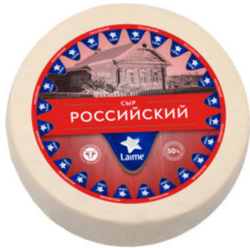
Сыр Laimе Российский 50%

Сыр Laimе Российский – классический полутвердый сыр из пастеризованного коровьего молока. Сырная масса пластичная, пористая, ажурная, вкус чистый, сырный с легкой кислинкой. Прекрасно подходит для канапе, бутербродов и сырных закусок.