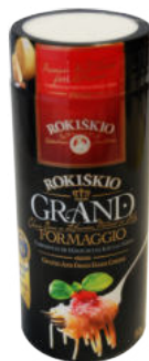
Тертый сыр Рокишкио Grand 37%

Сыр тертый Рокишкио Grand имеет утонченный аромат с нотками ореха, красивый насыщенный цвет. Подходит для добавления к пасте, ризотто, пицце, запеканкам, омлетам, салатам. Придаст блюдам глубину и пикантность. Благодаря представленной упаковке, удобен в использовании.