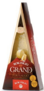
Твердый сыр Рокишкио Grand 37% 12 месяцев

Сыр твердый Рокишкио Grand сроком созревания 12 месяцев – хорошая альтернатива Пармезану. Сыр имеет красивый светлый оттенок, пикантный вкус с нотами ореха. Подходит для сырной тарелки, а также для добавления в пасту, ризотто и другие кулинарные блюда.