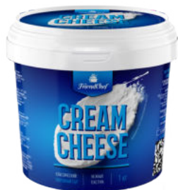
Сыр Cream Cheese творожный сливочный FriendChef 65%

Сыр Cream Cheese творожный сливочный FriendChef прекрасно подходит для японской, паназиатской кухни. Чистый сливочный вкус, однородная текстура, пластичная консистенция и термостабильность делают продукт отличным выбором для профессионалов, которые заботятся о качестве своих блюд.