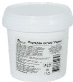
Маргарин мягкий "Париж" Bakery Mix

Маргарин мягкий "Париж" Bakery Mix имеет широкое применение в кондитерском производстве. Профессиональные высокотехнологичные продукты.