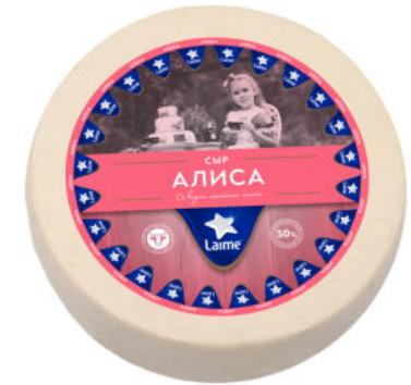
Сыр Laimе Алиса 50%

Сыр Laimе Алиса со вкусом топленого молока – полутвердый сыр с нежно-пряным послевкусием топленого молока. Отлично оттенит терпкий вкус кофе и придаст пикантности множеству кулинарных блюд.