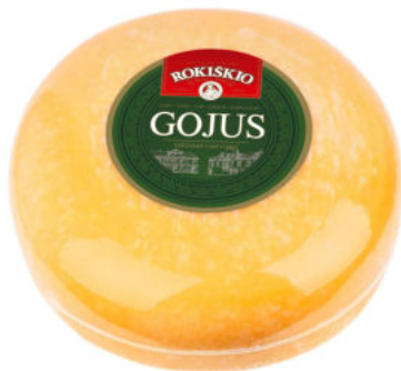
Сыр твердый Гоюс Рокишкио 40%

Сыр твердый Гоюс Рокишкио из коровьего молока, светло-желтого цвета, плотной, однородной консистенции, не крошится, с тонким сырным запахом и легкими пикантными нотками.