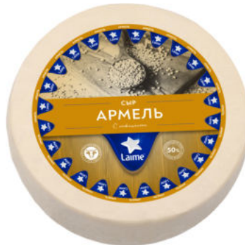
Сыр Laimе Армель 50%

Сыр Laimе Армель с пажитником – полутвердый сыр с плотной однородной сырной массой. Вкус нежный, пряный, с легкой ореховой нотой. Семя пажитника славится укрепляющими свойствами и помогает выводит шлаки.