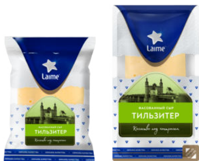
Сыр Laimе Тильзитер 50%

Сыр Laimе Тильзитер – популярный полутвердый сыр из отборного коровьего молока, богатый витаминами, нежного светлого оттенка, калорийный и питательный. Сырная масса покрыта дырочками и трещинами. Отличный столовый сыр.