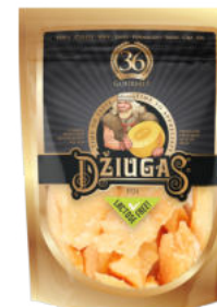
Сыр Пармезан Джюгас 36 месяцев колотый 40%

Сыр Пармезан Джюгас сроком созревания 36 месяцев обладает ярким изысканным вкусом и ароматом. Много белых кристаллов кальция, которые доказывают зрелость и качество сыра. Подходит для вечера, сочетается с орехами кешью.