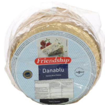
Сыр Данаблю плесенью Friendship 50%

брус 5 кг / 5 шт (уточните у представителя)