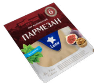
Сыр LaiMe Пармезан 6 месяцев 40%

Пармезан LaiMe сроком созревания 6 месяцев, имеет более насыщенный вкус, является отличным источником белка. Около 30г сыра в день обеспечат человека одной пятой частью суточной нормы протеинов. Помимо этого сыр содержит кальций и витамин Д, который улучшает усвоение кальция. Пармезан LaiMe бесподобен в сочетании с салатами, пастой, мясом, придает роскошный оттенок вкуса соусам, пирогам, бутербродам и запеканкам.