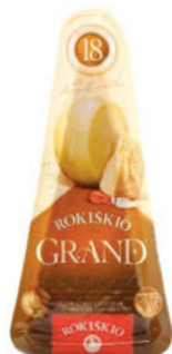
Твердый сыр Рокишкио Grand 37% 18 месяцев

Сыр твердый Рокишкио Grand сроком созревания 18 месяцев имеет более насыщенный вкус, хорошо подходит к белым винам и фруктам. Сыр имеет красивую текстуру, поэтому хорошо выглядит на сырной тарелке в колотом виде.