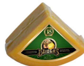
Сыр Пармезан Джюгас 18 месяцев ¼ круга 40%

Сыр Пармезан Джюгас сроком созревания 18 месяцев – сыр отличается пикантным вкусом, желтым цветом, в нем заметны белые кристаллы кальция. Порезанный тонкой стружкой сыр не только улучшит вкус, но и украсит супы и салаты. Сочетается с сухофруктами и хлебными палочками.