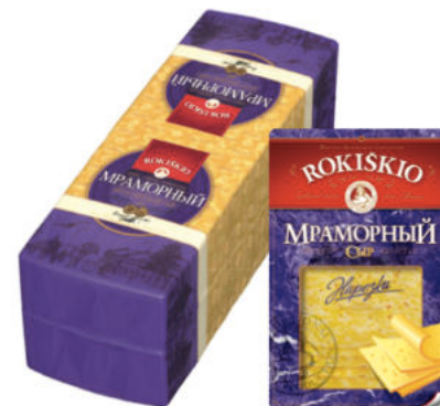
Сыр Мраморный Рокишкио 45%

Сыр полутвердый Мраморный Рокишкио имеет пластичную структуру в красивых разводах и сладковатый, немного пряный вкус. Мраморный сыр богат жирными кислотами и микроэлементами.