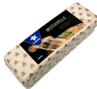
Сыр LaiMe Моцарелла 45%

Сыр LaiMe Моцарелла отлично раскрывает свои вкусовые свойства, особенно при термической обработке, прекрасно тянется. Подходит для приготовления пицц, горячих бутербродов, запеканок.