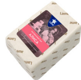
Сыр Laimе Алиса 50%

Сыр Laimе Алиса со вкусом топленого молока – полутвердый сыр с нежно-пряным послевкусием топленого молока. Отлично оттенит терпкий вкус кофе и придаст пикантности множеству кулинарных блюд.