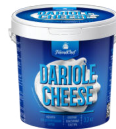
Сыр Dariole Cheese творожный сливочный FriendChef 72%

Сыр Dariole Cheese творожный сливочный FriendChef – приятный молочный вкус с легкой кислинкой, творожистая текстура. Подходит для приготовления чизкейков, тирамису. Линейка высококачественных молочных продуктов для HoReCa.