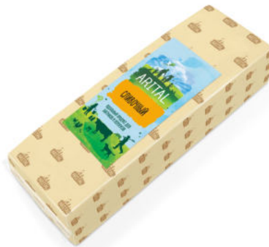
Продукт полутвердый Arital Сливочный 50%

Продукт полутвёрдый ARITAL Сливочный обладает легким сливочным ароматом и нежным вкусом. Помимо этого продукт содержит белок, необходимый для рациона.