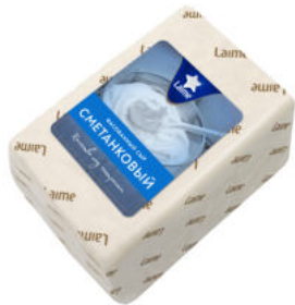
Сыр Laimе Сметанковый 50%

Сыр Laimе Сметанковый – нежный традиционный полутвердый сыр с пластичной, однородной, ажурной текстурой, тонким сливочным ароматом и легкой кислинкой. Можно подать с фруктами или вареньем.