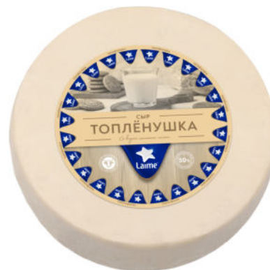
Сыр Laimе Топленушка 50%

Сыр Laimе Топленушка – полутвердый сыр на топленом коровьем молоке. Сыр имеет нежный вкус топленого молока, насыщенный аромат и плотную текстуру. Хорошо сочетается с кофе, ягодами, медом.