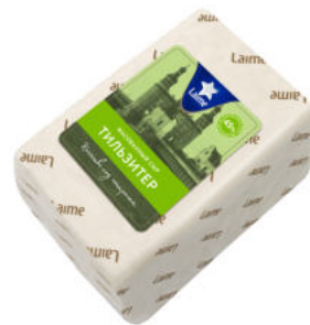
Сыр Laimе Тильзитер 45%

Сыр Laimе Тильзитер – популярный полутвердый сыр из отборного коровьего молока, богатый витаминами, нежного светлого оттенка, калорийный и питательный. Сырная масса покрыта дырочками и трещинами. Отличный столовый сыр.