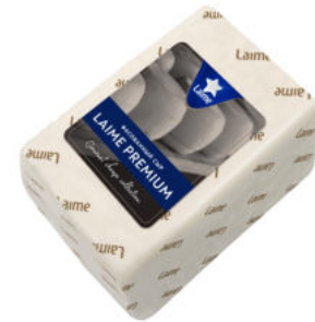
Сыр Laimе Премиум 50%

Сыр Laimе Премиум – полутвердый сыр, с плотной пористой текстурой, светло-желтого цвета, с нежным сливочным ароматом. Прекрасно подойдет для горячих бутербродов, как ингредиент для омлетов, запеканок, салатов и в качестве самостоятельной закуски.