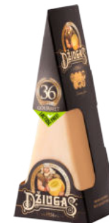
Сыр Пармезан Джюгас 36 месяцев треугольник 40%

Сыр Пармезан Джюгас сроком созревания 36 месяцев обладает ярким изысканным вкусом и ароматом. Много белых кристаллов кальция, которые доказывают зрелость и качество сыра. Подходит для вечера, сочетается с орехами кешью.