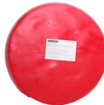
Сыр "Danish Fontina"

Сыр "Danish Fontina» - полутвердый прессованный сыр из коровьего молока. Сыр отлично плавится и широко применяется в кулинарии: для приготовления супов, соусов.