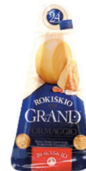
Твердый сыр Рокишкио Grand 37% 24 месяца

Сыр твердый Рокишкио Grand сроком созревания 24 месяца – глубокий богатый вкус сыра можно подчеркнуть, подав к нему мед, сухофрукты и орехи. Достойное украшение стола.