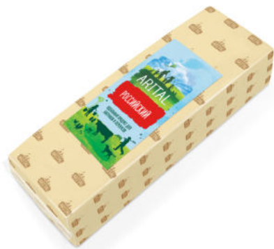
Продукт полутвердый Arital Российский 50%

Продукт полутвёрдый ARITAL Российский имеет светло-жёлтый цвет, плотную консистенцию, умеренно выраженный сырный вкус и лёгкую кислинку. Растительные масла, содержащиеся в продукте, содержат витамины А, Е, Д, антиоксиданты.