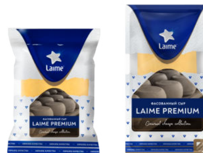
Сыр Laimе Премиум 50%

кусок 240 г / 10 шт слайсы 125 г / 12 шт