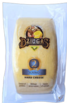
Сыр Пармезан Джюгас 2 месяцев ¼ круга 40%

Сыр Пармезан Джюгас сроком созревания 2 месяца – молодой сыр, твердой однородной консистенции, с пикантным ароматом и солоноватым вкусом. Сыр отлично подойдет как дополнение к пасте, ризотто, супам и салатам. Сыр также можно красиво поколоть и подать к вину и фруктам.