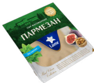
Сыр LaiMe Пармезан 38% - 40%

Пармезан LaiMe – твердый сыр с ломкой текстурой, нежным вкусом, тонким приятным ароматом. Первокласное качество не оставит равнодушным ценителей сыров. Лёгкий, прекрасно усваивающийся сыр удобен в качестве здорового перекуса в течение дня, так как быстро дарит насыщение.