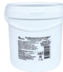
Профессиональный продукт со вкусом сыра "Токио" Bakery Mix

упаковка 1 кг / 1 шт упаковка 3,3 кг / 1 шт