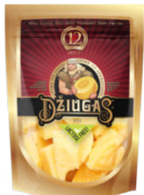
Сыр Пармезан Джюгас 12 месяцев колотый 40%

Сыр Пармезан Джюгас сроком созревания 12 месяцев – сыр с нежным вкусом, ароматный и пластичный. Он понравится детям и молодежи, рекомендуется добавлять его в блюда для завтрака. Сочетается со свежими фруктами – виноградом, клубникой, голубикой. В сыре уже начинают формироваться кристаллики кальция.