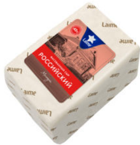
Сыр Laimе Российский 50%

Сыр Laimе Российский – классический полутвердый сыр из пастеризованного коровьего молока. Сырная масса пластичная, пористая, ажурная, вкус чистый, сырный с легкой кислинкой. Прекрасно подходит для канапе, бутербродов и сырных закусок.