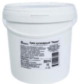
Крем кулинарный "Париж" Bakery Mix

Крем кулинарный "Париж" Bakery Mix - вкус с легкой сырной нотой, немного солоноватый, с приятной кислинкой. В меру плотная, пластичная, однородная консистенция. Идеальный продукт для приготовления крем-чиза и десертов. Изготовлен на основе растительных масел.