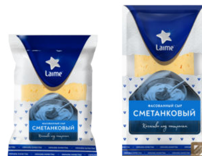
Сыр Laimе Сметанковый 50%

кусок 240 г / 10 шт слайсы 125 г / 12 шт