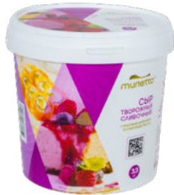
Сыр творожный сливочный Милетто 62%

Сыр творожный сливочный Милетто – незаменимый ингредиент шеф-повара. Продукт подходит для приготовления широкого ассортимента блюд, как горячих, так и холодных.