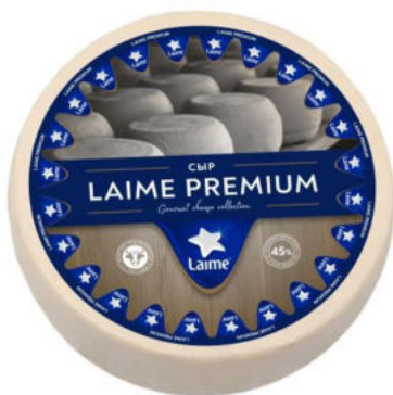
Сыр LaiMe Премиум 50%

Сыр LaiMe Премиум – полутвердый сыр, с плотной пористой текстурой, светло-желтого цвета, с нежным сливочным ароматом. Прекрасно подойдет для горячих бутербродов, как ингредиент для омлетов, запеканок и в качестве самостоятельной закуска.