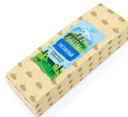
Продукт полутвердый Arital Сметанковый 50%

Продукт полутвёрдый ARITAL Сметанковый с тонким ароматом свежего молока и кислинкой. Нежный деликатный вкус продукта замечательно дополнит аромат утреннего кофе.