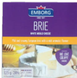
Сыр Бри с белой плесенью Emborg

Сыр Бри с белой плесенью – один из самых популярных видов мягких сыров в мире. Тесто сыра мягкое со сливочно-ореховым вкусом с легкой горчинкой и плотной упругой корочкой. Бри обычно подают как закуску или десерт с крекерами, багетом, грушами, виноградом или медом, сопроводив сухим вином.