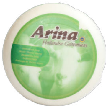
Сыр Козий Chevrete "Арина"

Сыр Козий Chevrete "Арина" – полутвердый сыр из козьего молока, обладает нежным молочным вкусом. Подходит для приготовления салатов, в том числе фруктовых, для сырных тарелок, под сухое вино, хорошо сочетается с пастой и овощами.