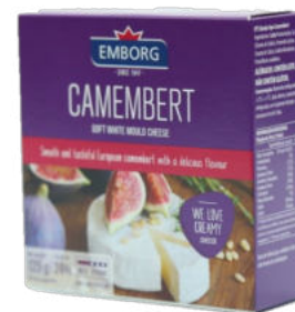
Сыр Камабер с белой плесенью Emborg

Сыр Камамбер с белой плесенью – еще один популярный вид мягкого сыра с белой плесенью. Нежный, выраженный сливочный аромат, тонкий пикантный вкус, упругая корочка и кремовая начинка. Вкус сыра раскрывается при комнатной температуре, поэтому рекомендовано заранее выкладывать его из холодильника перед употреблением.