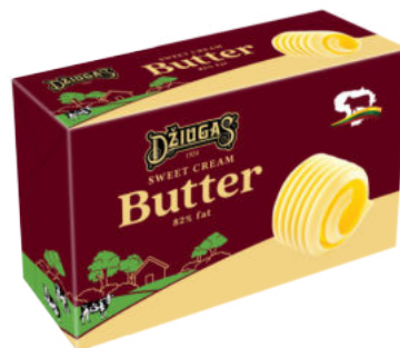
Масло сливочное Джюгас 82%

Масло сливочное Джюгас изготовлено из свежих сладких сливок, имеет нежный сливочный вкус и правильную текстуру, легко намазывается. Рекомендовано употреблять сливочное масло ежедневно понемногу особенно в утренние часы, с кашей, бутербродом с сыром, блинчиками.