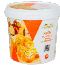
Крем со вкусом сыра сливочного Милетто

упаковка 3,3 кг / 1 шт упаковка 10 кг / 1 шт