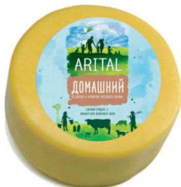
Продукт полутвердый Arital Домашний 50%

Продукт полутвёрдый ARITAL Домашний с нейтральным ароматом быстро утоляет голод и дарит ощущение насыщения. Продукт подойдёт для бутербродов, нарезок, рулетов и омлетов, его можно натереть и добавить в пасту, пиццу, запеканки, супы и соусы.