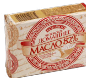
Масло сливочное "Домашнее" Рокишкио 82%

Масло сливочное "Домашнее" Рокишкио обладает нежным сливочным вкусом, приятным молочно-сливочным послевкусием, не крошится при намазывании. Подходит для использования в кулинарии.