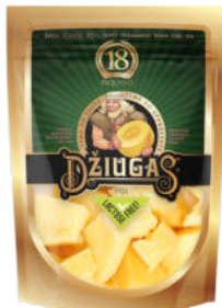
Сыр Пармезан Джюгас 18 месяцев колотый 40%

Сыр Пармезан Джюгас сроком созревания 18 месяцев – сыр отличается пикантным вкусом, желтым цветом, в нем заметны белые кристаллы кальция. Порезанный тонкой стружкой сыр не только улучшит вкус, но и украсит супы и салаты. Сочетается с сухофруктами и хлебными палочками.