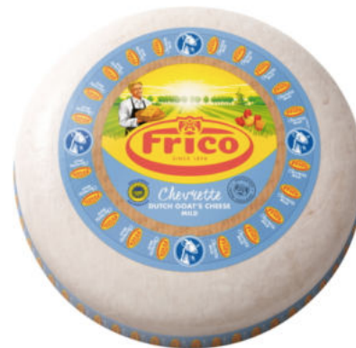
Сыр Козий Chevrette Frigo

Сыр Козий Chevrette Frigo изготавливается из свежего козьего молока, имеет светлое тесто сыра, аромат и вкус козьего молока. Сыр прекрасно подходит для салатов с добавлением груши, запеканок, пиццы, а также является источником белка и витаминов.