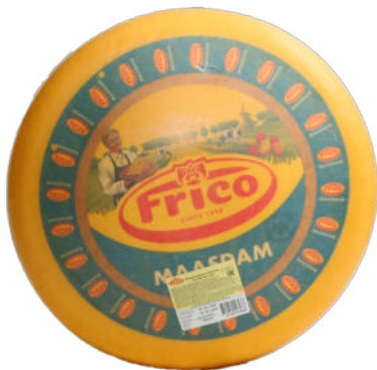
Сыр Маасдам Frigo

Сыр Маасдам Frigo – полутвердый голландский сыр из коровьего молока, имеет насыщенный сливочный сладковато-ореховый вкус и приятную плотную консистенцию. Сыр подходит для бутербродов, выпечки, фруктовых салатов и десертов. Помимо этого, Маасдам украсит собой любую сырную тарелку в сочетании с белыми винами.