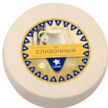
Сыр Laimе Сливочный 50%

Сыр Laimе Сливочный – полутвердый сыр с пористой сырной массой. Имеет легкий сливочный сладковатый аромат, нежное приятное послевкусие. Хорошо подойдет к чашечке кофе, а также внесет нежную сливочную ноту в запеканки и соусы.