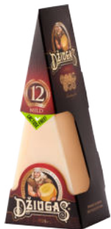
Сыр Пармезан Джюгас 12 месяцев треугольник 40%

Сыр Пармезан Джюгас сроком созревания 12 месяцев – сыр с нежным вкусом, ароматный и пластичный. Он понравится детям и молодежи, рекомендуется добавлять его в блюда для завтрака. Сочетается со свежими фруктами – виноградом, клубникой, голубикой. В сыре уже начинают формироваться кристаллики кальция.