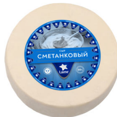
Сыр Laimе Сметанковый 50%

Сыр Laimе Сметанковый – нежный традиционный полутвердый сыр с пластичной, однородной, ажурной текстурой, тонким сливочным ароматом и легкой кислинкой. Можно подать с фруктами или вареньем.