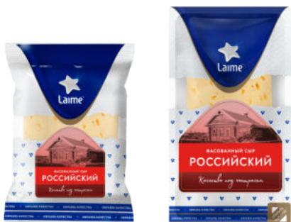
Сыр Laimе Российский 50%

Сыр Laimе Российский – классический полутвердый сыр из пастеризованного коровьего молока. Сырная масса пластичная, пористая, ажурная, вкус чистый, сырный с легкой кислинкой. Прекрасно подходит для канопе, бутербродов и сырных закусок.