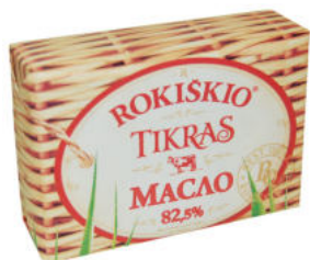
Масло сливочное "Рокишкио Тикрас" 82%

Масло сливочное "Рокишкио Тикрас» имеет нежный сладко-сливочный вкус, правильную текстуру. Сливочное масло – натуральный источник витаминов, микроэлементов и минералов. Особенно вкусно масло раскрывается на горячем тосте. Можно добавлять в каши, пюре.