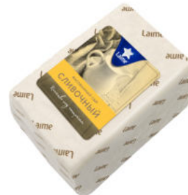
Сыр Laimе Сливочный 50%

Сыр Laimе Сливочный – полутвердый сыр с пористой сырной массой. Имеет легкий сливочный сладковатый аромат, нежное приятное послевкусие. Хорошо подойдет к чашечке кофе, а также внесет нежную сливочную ноту в запеканки и соусы.