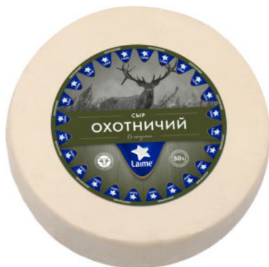
Сыр Laimе Охотничий 50%

Сыр Laimе Охотничий – полутвердый сыр с пряными специями. Имеет богатый насыщенный вкус. Отлично подойдет для сырной тарелки в дополнение к шашлыку или мясу на гриле, а также добавит пикантности блюдам как дополнительный ингредиент: соусам, запеченному мясу и птице.